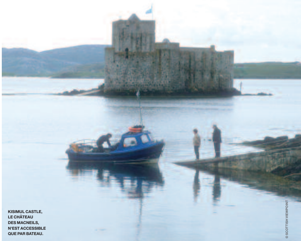
KISIMUL CASTLE, LE CHÂTEAU DES MACNEILS, N'EST ACCESSIBLE QUE PAR BATEAU.